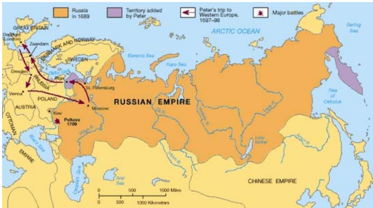
01-01 Mapa de Rusia bajo Pedro el Grande

El imperio de Rusia es el más vasto de nuestro hemisferio; su extensión, de Occidente a Oriente, es de más de dos mil leguas comunes de Francia 1 , y tiene más de ochocientas leguas de Sur a Norte, en su mayor anchura. Limita con Polonia y el mar Glacial; toca a Suecia y a la China. Su longitud desde la isla de Dago al occidente de Livonia, hasta sus confines más orientales, comprende cerca de ciento setenta grados; de suerte que cuando es mediodía en el occidente es casi media noche en el oriente del imperio.