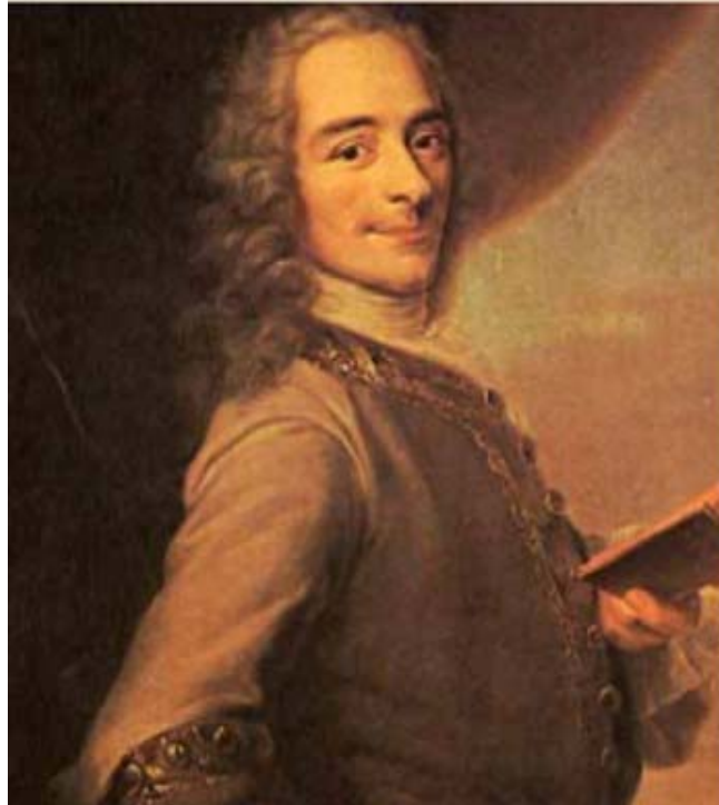
Francisco María Arouet (Voltaire)

Filósofo y considerado uno de los padres de las letras francesas, la personalidad de Voltaire estuvo siempre ligada al ingenio, la ironía, la inteligencia y el escándalo. Voltaire es el pseudónimo de François-Marie Arouet, hijo de un notario, que nació en París el 21 de noviembre de 1694.