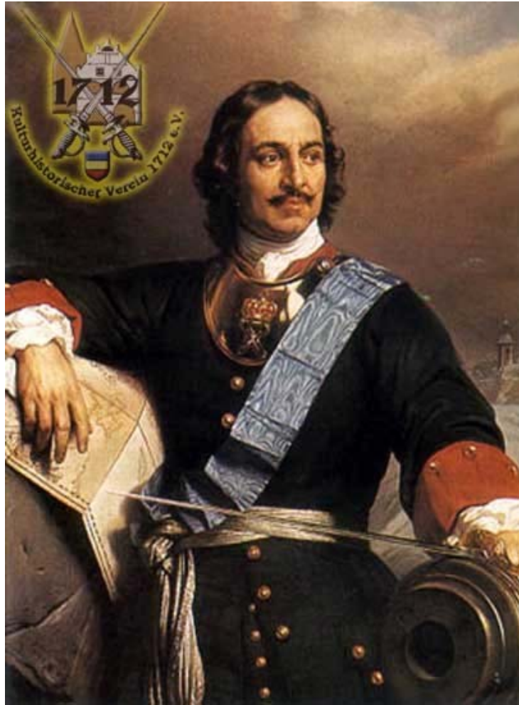
01-02 Pedro el Grande

Un embajador inglés que residía en 1733 en Petersburgo y que había estado en Madrid dice en su relato manuscrito que en España, que es el reino de Europa menos poblado, se pueden calcular cuarenta personas por cada milla cuadrada, y que en Rusia no se pueden contar más que cinco; en el capítulo segundo veremos si este ministro se ha engañado. Se dice en el Diezmo , falsamente atribuido al mariscal de Vauban, que en Francia cada milla cuadrada contiene aproximadamente doscientos habitantes una con otra. Estas evaluaciones no son nunca muy exactas, pero sirven para mostrar la enorme diferencia de la población de un país a la de otro.